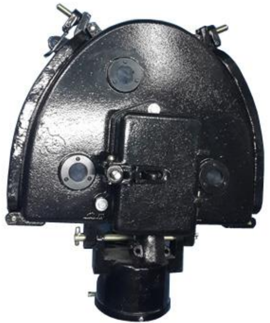
Imagen N° 3: Vista Posterior