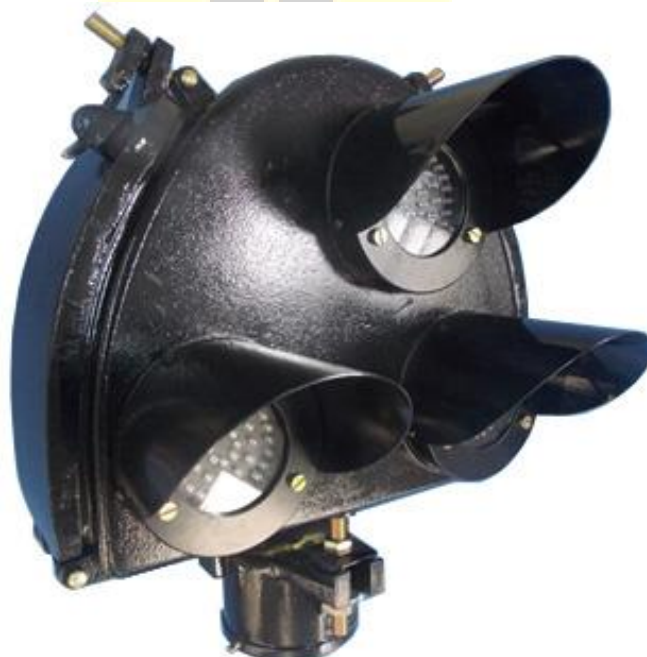
Imagen N° 1: Vista Frontal