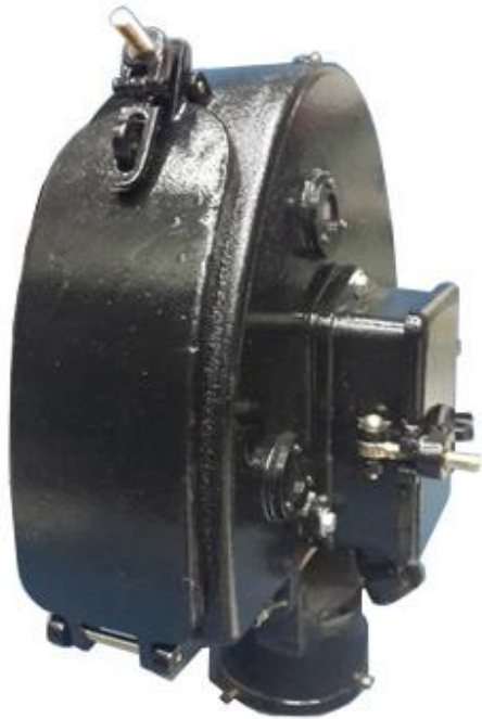
Imagen N° 2: Vista Lateral Trasera