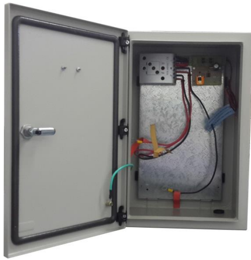
Imagen N° 3 – Foto del Interior del Gabinete de Control