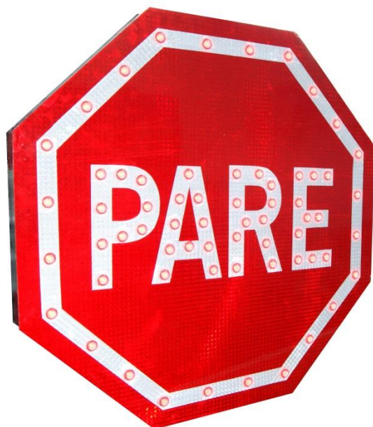
Imagen N° 1 – Señal PARE Construida Con LEDs Rojos de Alta Intensidad