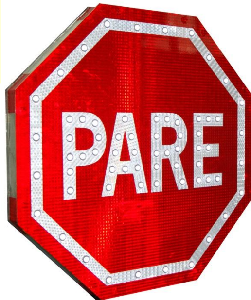
Imagen N° 2 – Señal PARE Construida Con LEDs Blancos de Alta Intensidad