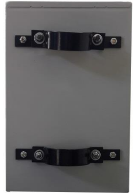
Imagen N° 4 – Foto Posterior del Gabinete de Control